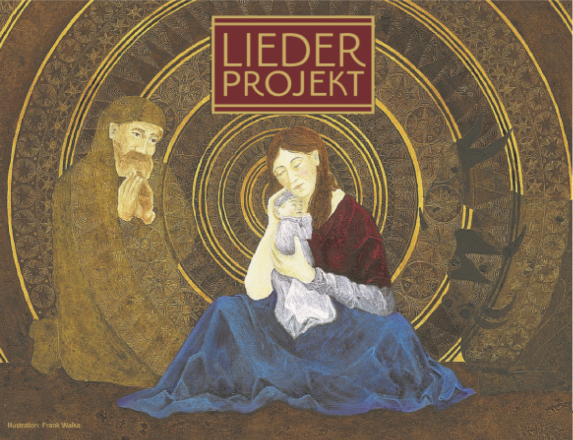
Illustration: Frank Walka