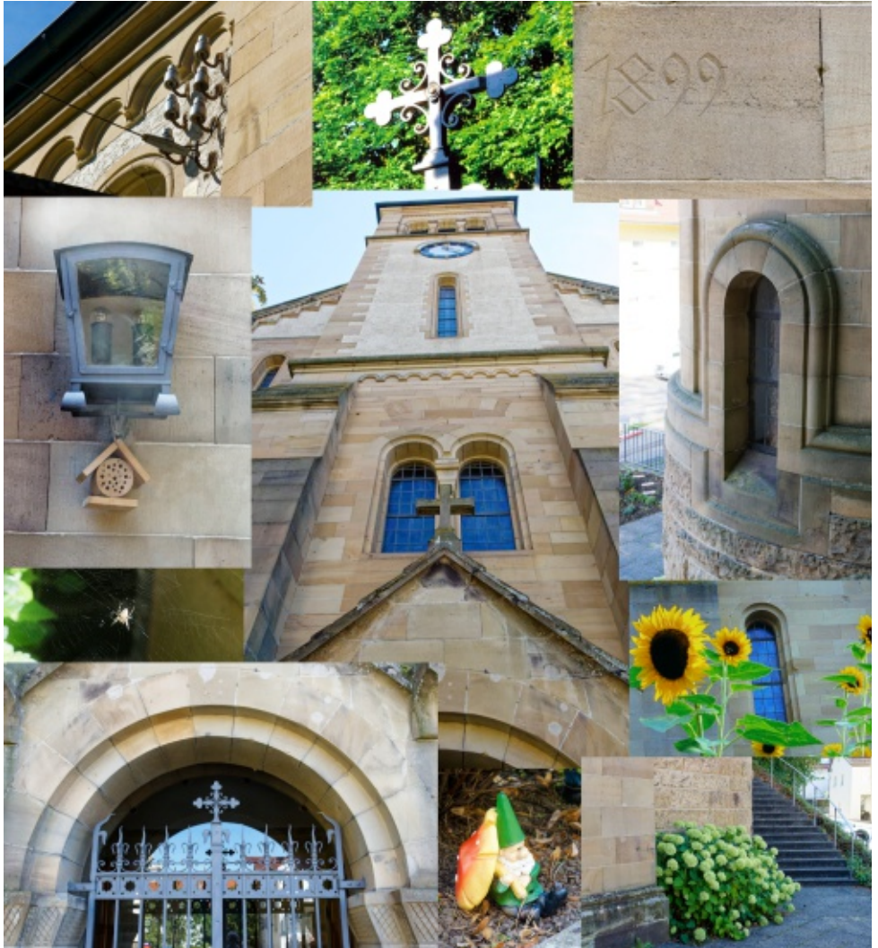
125 Jahre Matthäus-Kirche in Alt-Sontheim