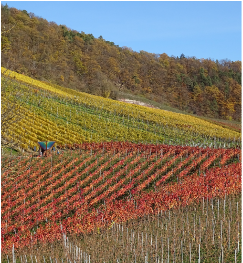
Herbstliche Farben am Weitblickweg in Hohenhaslach